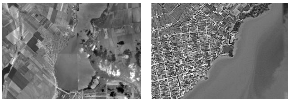
Figure 1. The location of the place where the amphora was discovered.